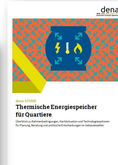
Analyse zu thermischen Energiespeichern im Quartier