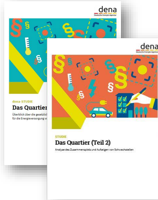
Analysen zum Rechtsrahmen Veröffentlichung ‚Das Quartier Teil 2‘ Januar 2022